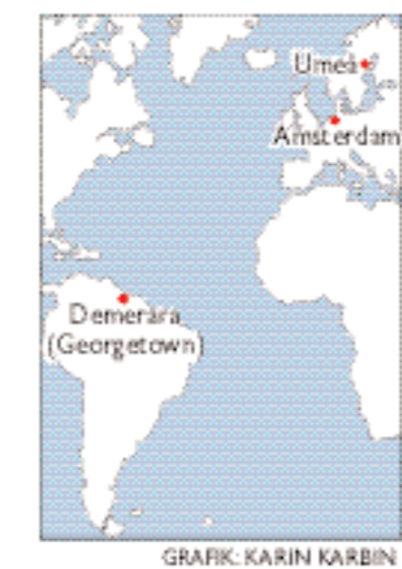
GRAFIK: KARIN KARBIN

Att det skulle ha varit en kalvinistisk biskop som hamnade i Umeå räknas i dag som en saga. Däremot tror forskare att svenska kronan medvetet placerade flyktingfamiljen i Umeå för att få fart på den lilla staden. Bland annat förde lambertarna med sig ett förmånligt bibliotek, som kom att utgöra grunden till ett bildningsväsende i staden. Likaså var familjen framgångsrika skeppsbygga-